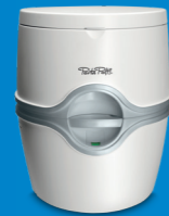
Porta Potti 565

El Porta Potti es un sistema sanitario cerrado compacto y ligero. El inodoro portátil puede colocarse prácticamente en cualquier sitio. El Porta Potti se utiliza a menudo en carpas, tiendas de campaña, autocaravanas con remolque y barcos. También pueden resultar prácticos durante las reformas del hogar, o para casas de verano o de jardín. Pueden colocarse en cualquier habitación de la casa y son aptos para todas las edades, e incluso en caso de movilidad reducida.