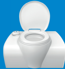
Model met vaste toiletspot

Het ingebouwde cassettoilet is een vast gemonteerd toilet dat bestaat uit twee essentiële delen: