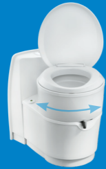
Model met draibare toiletspot

Het comfort van uw toilet thuis in uw camper of caravan